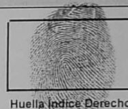
Huella Índice Derecho